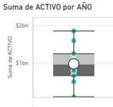
Gráfico 4 Suma de activo por Año Diagrama de cajas