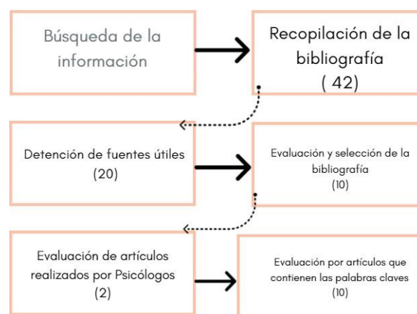
Figura 1 Flujograma del proceso de selección de fuentes bibliográficas.

Nota. Flujograma [Fotografía], Vásquez Dayanara, (2021).